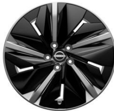
19" Disky kolies z ľahkých zliatin