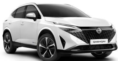
Biela Pearl QBE - 800 €