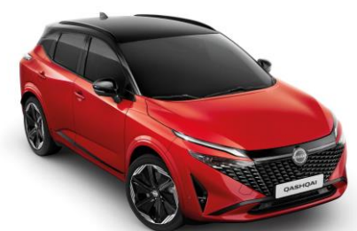
Červená Sunset a Čierna YAU - 1000 €