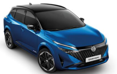
Modrá Magnetic a Čierna XGZ - 1000 €