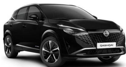
Čierna Pearl GAT - 600 €