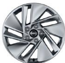
17" Disky kolies z ľahkých zliatin