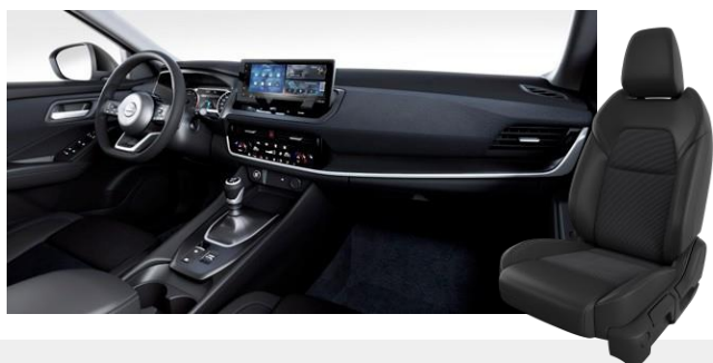
Látkové čalúnenie čierne [G]