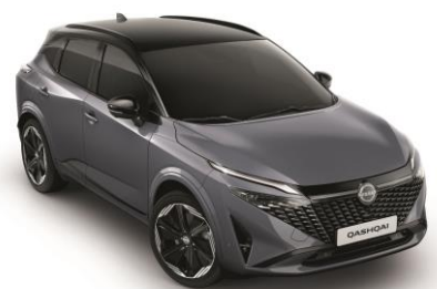
Sivá Ceramic a Čierna XEX - 1000 €