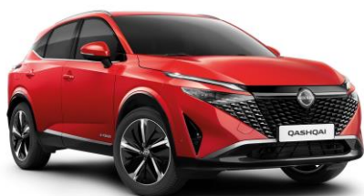
Červená Sunset NBV - 800 €