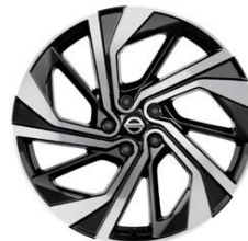
20" Disky kolies z ľahkých zliatin