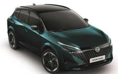
Zelenomodrá Ocean a Čierna YBJ - 1000 €