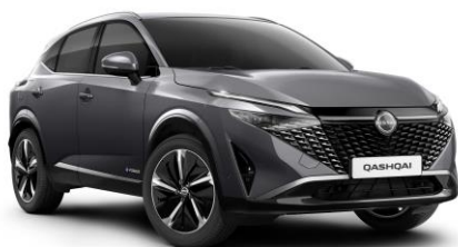
Sivá Gunmetal KAD - 600 €