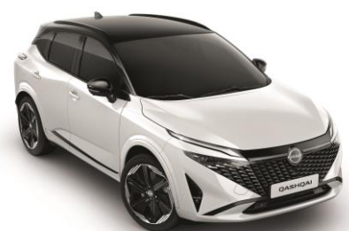
Biela Pearl a Čierna XKJ - 1000 €