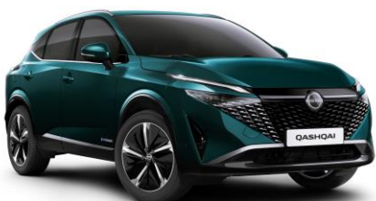
Zelenomodrá Ocean FAP - 800 €