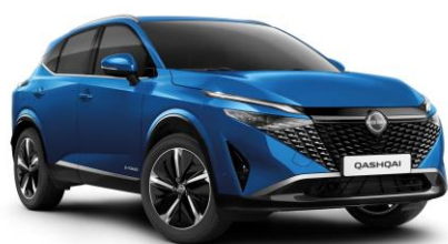
Modrá Magnetic RCF - 800 €