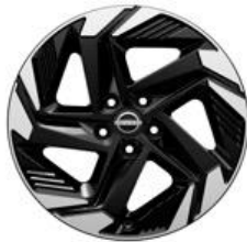
18" Disky kolies z ľahkých zliatin