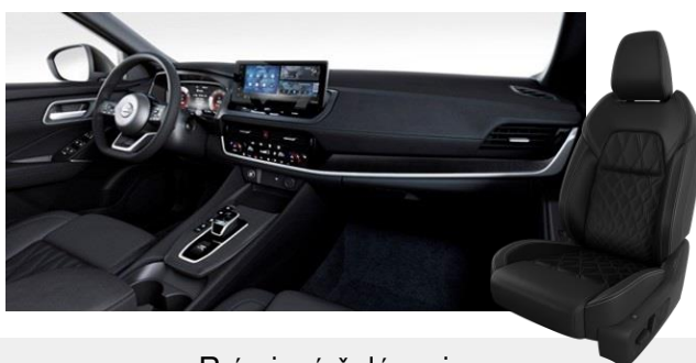
Prémiové čalúnenie Prešivaná koža / Alcantara [Z]