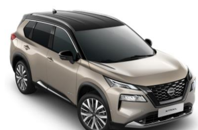
Strieborná Champagne - Čierna XEW - 1 350 €