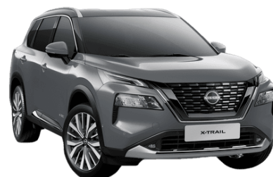
Sivá Ceramic KBY - 850 €