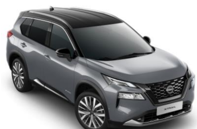
Sivá Ceramic - Čierna XEX - 1 350 €