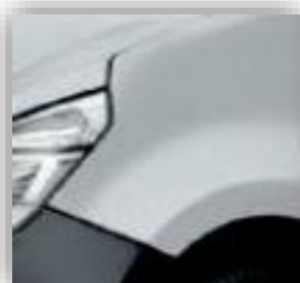
Šedá Star - KNH