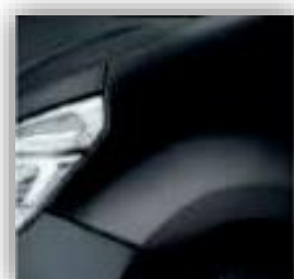
Čierna - 676