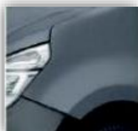
Modrošedá - J47