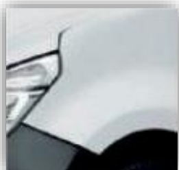
Biela - QNG (bez príplatku)