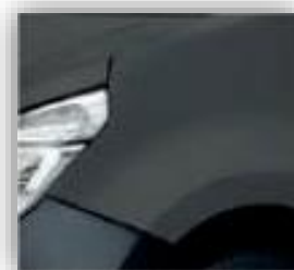
Šedá Urban - KPW